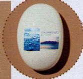
Kenzo Ryoko, Eau de Toilette, 20 ml ca. 25 Euro

? Schon vor mehr als 5000 Jahren verbrannten die Ägypter Duftstoffe zu Ehren des Sonnengottes Ra. „Per fumum“ nannten das die Römer, woraus