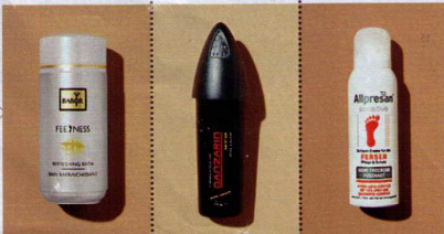
Allpresan, Fersencreme, 125 ml ca. 10 Euro